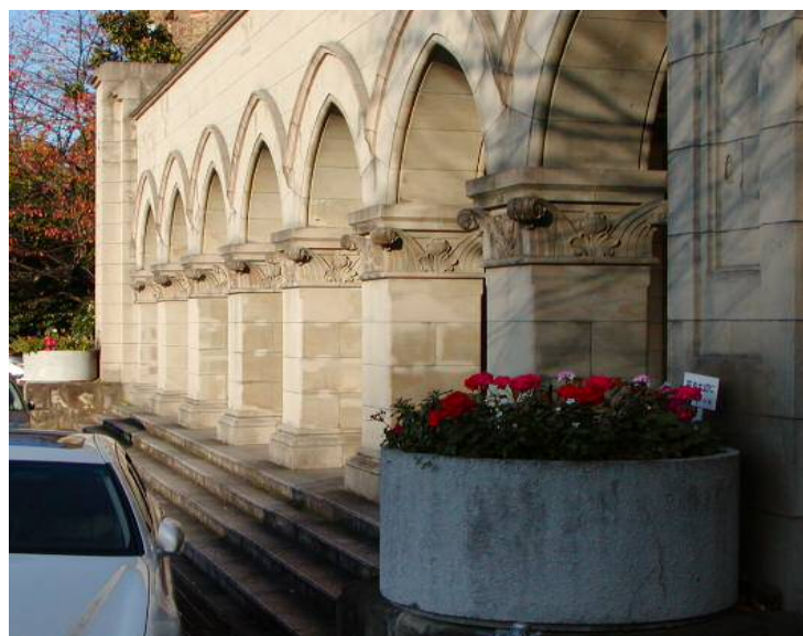
管理.研究棟 (植栽設置)