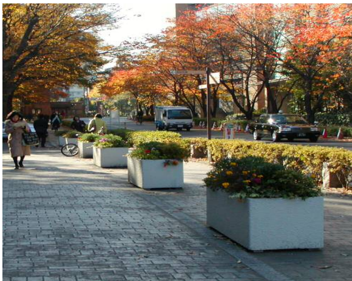
南研究棟前 (植栽設置)