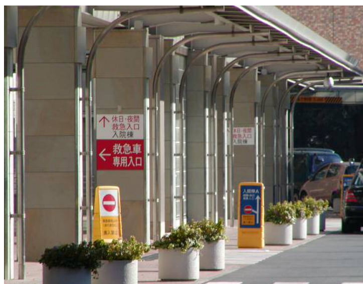
入院棟A前 (植栽設置)