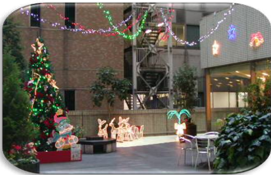
クリスマスイルミネーション