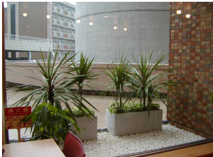
入院棟A ホール (植栽設置)