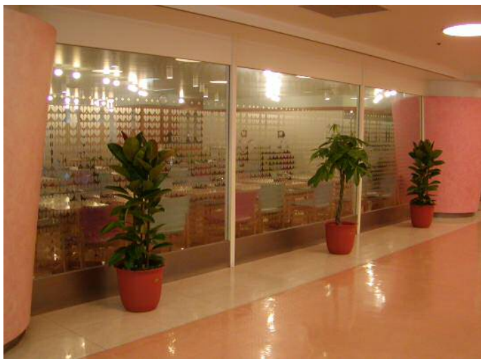
入院棟A 通路 (植栽設置)