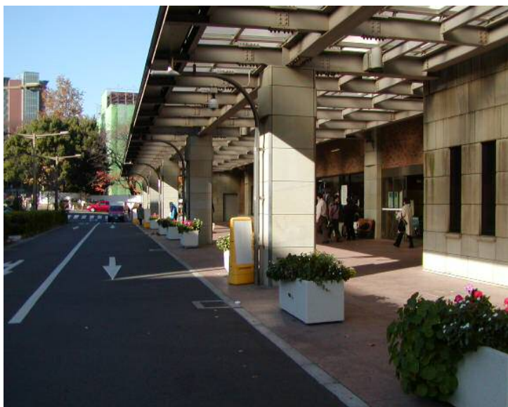
外来玄関前 (植栽設置)