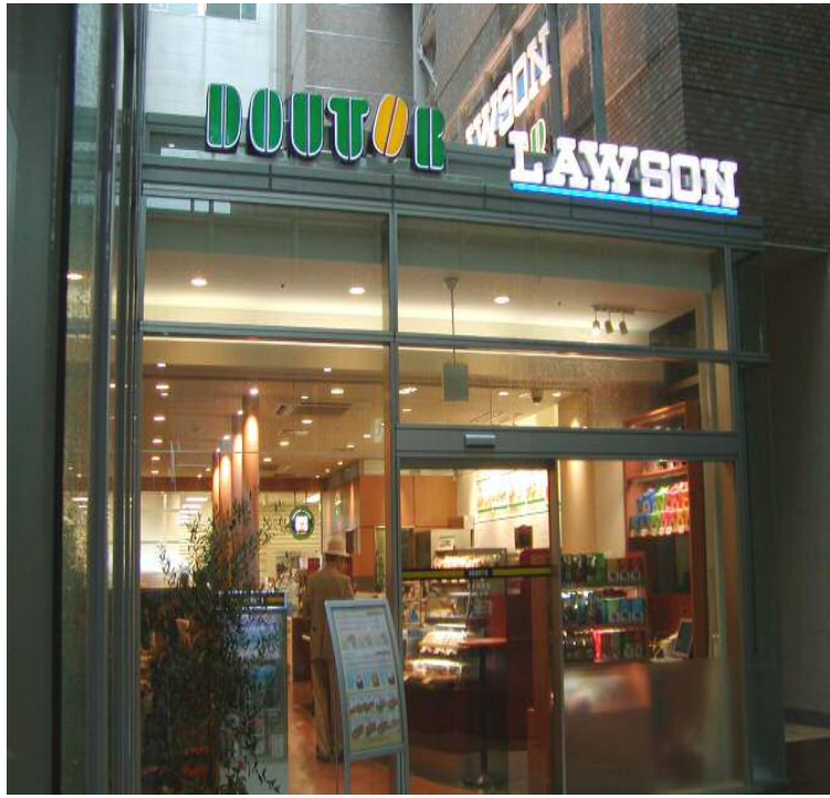
ドトール店・ローソン店