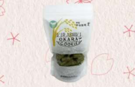
米粉宇治抹茶 540円~648円(税込)