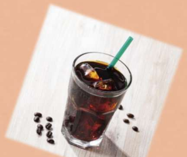
水出し アイスコーヒー Tall 税込515円