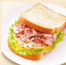
モーニング・セットB パストラミポーク &ポテト ¥500~