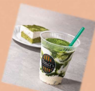
抹茶ティラミス シェイク 税込720円