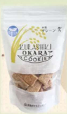
米粉シリーズ各種 各648円(税込)~