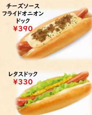
チーズソース フライドオニオン ドック ¥390