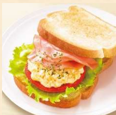
モーニング・セットA ハムタマゴサラダ ¥480~