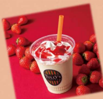
ご褒美いちご ティーリスタ 税込700円