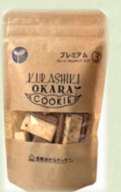
1番人気 プレミアム3種 540円(税込)