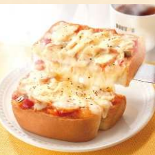
ホットモーニング スモークチキン&トマト ¥540~