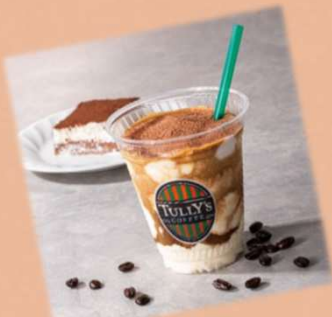
マスカルポーネ ティラミスシェイク 税込720円