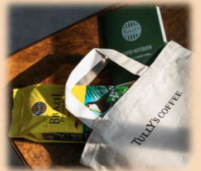
スクール参加者へのお土産