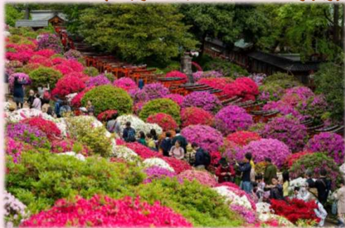
一番多くのお花が咲くタイミングは 4月上旬~中旬(4月10日前後)