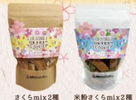
さくらmix2種 米粉さくらmix2種