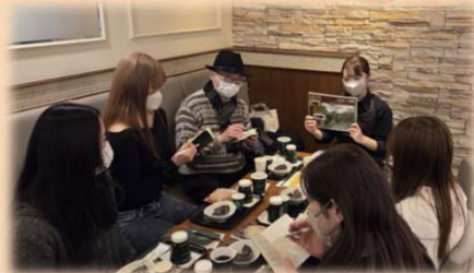
東大病院店のコーヒースクールの様子