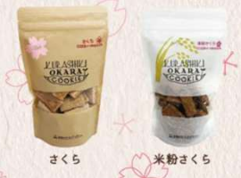
さくら 米粉さくら